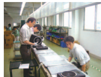
AQL 抜取基準に基づく検品作業の様子

当社は多くのPB商品の製造を海外工場に委託していますが、品質の安定化を目指し、製造現場での監査・助言を行っています。また、PB商品は工場出荷の直前、またはロジスティクスセンターに入荷した時点で、世界的に広く採用されている合格品質基準(AQL=Acceptable Quality Level)に基づいて検査を行っています。さらに、PB商品、NB商品を問わず、全ての取引先に対し、適宜、商品の不具合情報を提供し低品質の商品を水際で防ぐ活動をしています。