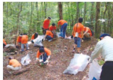
富士山麓での清掃活動風景

また、企業市民として地域に貢献するため、2005年以降毎週、本社所在地周辺の清掃活動を実施し、環境美化に努めています。