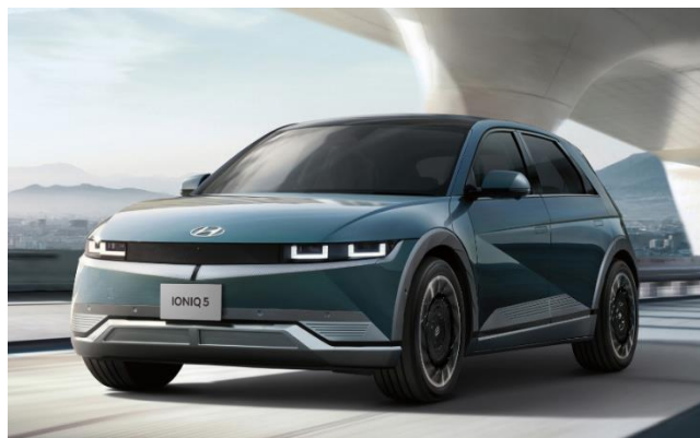
電気自動車 (EV) 「IONIQ 5 (アイオニック ファイブ)」

当社と Hyundai は、今後全国のオートバックスグループ店舗を通じて、同社車両の整備・メンテナンスを中心に連携・協業していくことについて検討してまいります。