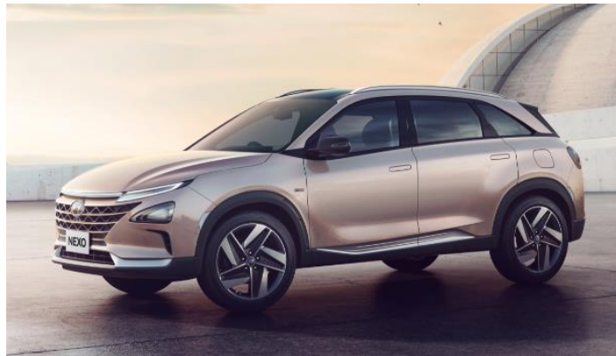
水素電気自動車 (FCEV) 「NEXO (ネツ)」