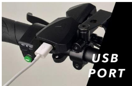
USBポート (オプション品) ※2017年12月末までにご予約を いただいた方に限定でプレゼント