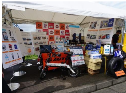
【昨年の当社の出展ブース】

当社は2014年より、出場するチームに対しレーシングスーツやシューズなどの物品や、SUPER GTでのピット見学への招待などさまざまな方法で支援し、クルマに向き合う学生の活動を応援してきました。一昨年の第14回大会からはスポンサー企業として大会に参画するとともに、今年も過去最多となる12チームへの支援を行います。また、大会期間中の最終2日間は企業ブースを出展し、大会に参加する学生や来場者に対しオートバックスの取り組みについて紹介する予定です。