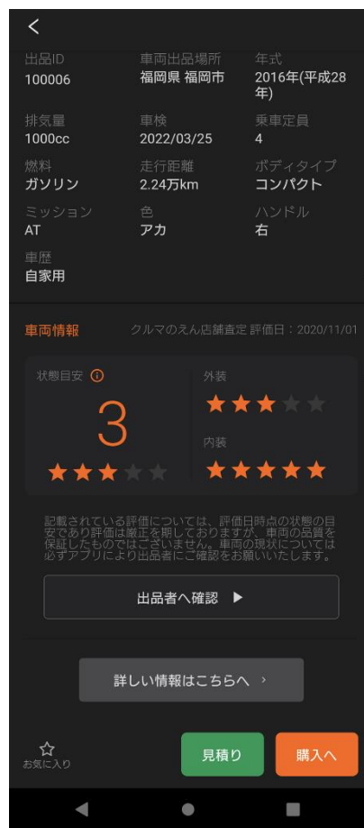
【クルマの状態目安】

当サービスの名称は、中古車の売買を行うお客様同士の「縁」を紡ぎ、C to Cプラットフォームを通じてみんながつながる「円」、クルマのテーマパーク「園」になる、という思いを込めて「クルマのえん」と名付けました。「クルマのえん」は売り手と買い手を繋ぐ安心・安全なプラットフォームとして、中古車の個人間売買をサポートします。