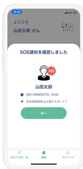
3. 緊急通知ボタンでSOSを通知