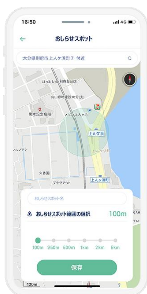
2. 出発と到着を教えてくれる