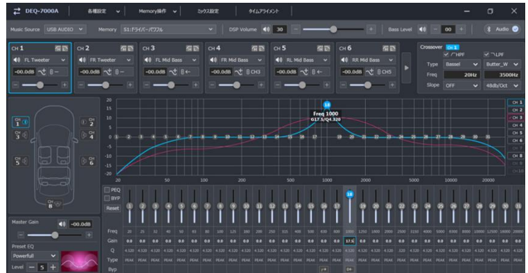
パソコン画面 ※イメージ