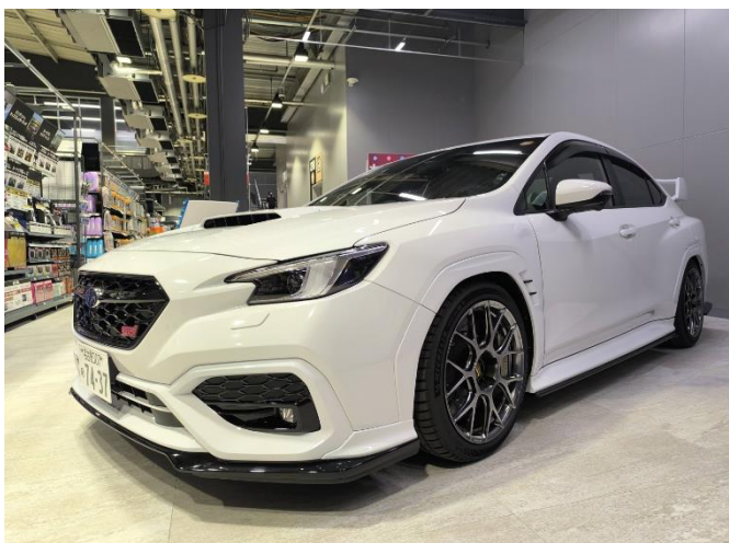
パイオニアのハイエンド・スピーカー「GRAND RESOLUTION」シリーズを体感できるデモカー