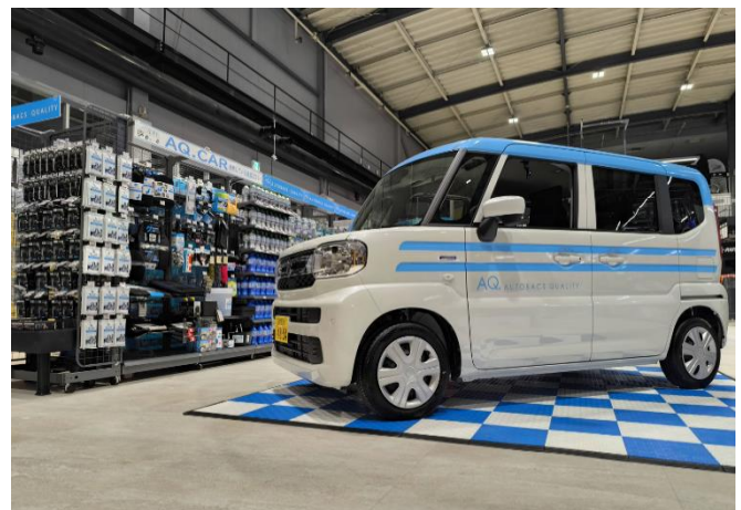
AQ.の車内外の用品などを試せるデモカー