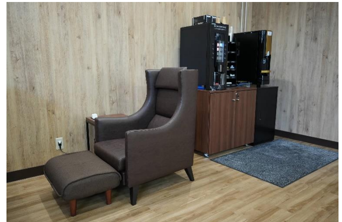
2階ラウンジ：作業などの待ち時間を過ごせる上質な空間