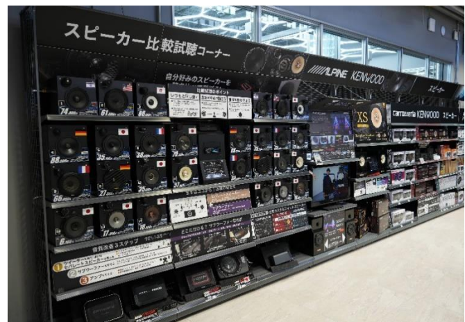
さまざまなカテゴリーで充実した体感・比較コーナーを展開