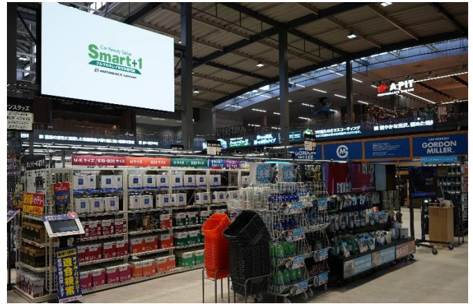
メインと壁面ライン状のLEDビジョンによるアリーナ演出