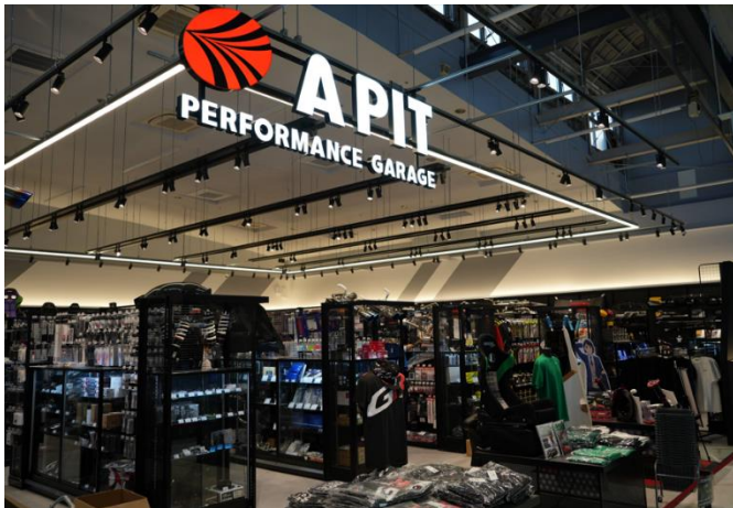
豊富な在庫とプロによるカスタム提案

商品を比較・体感できるコーナーやデモカーを多数設置し、デジタルサイネージで旬のアイテムやカテゴリーの売れ筋ランキングなどを紹介することで、エンターテインメント性のある売場体験を提供します。