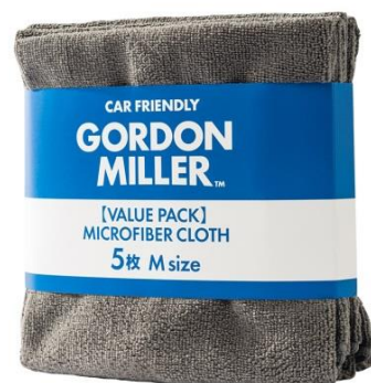
GORDON MILLER MICROFIBER CLOTH 5枚 M size ※7月下旬発売予定 799円