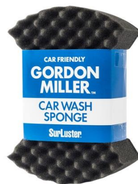
GORDON MILLER CAR WASH SPONGE 399円