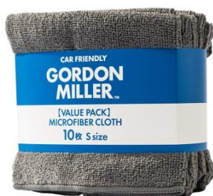
GORDON MILLER MICROFIBER CLOTH 10枚 S size 749円