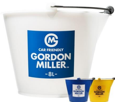
GORDON MILLER バケツ 8L ※イエロー／ブルーについては 7月下旬発売予定 各 699円