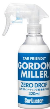
GORDON MILLER ZERO DROP 320ml 2,299円